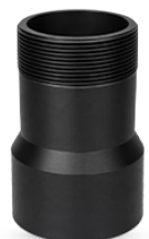
Dimensioni delle Riduzioni

U-PVC di alta qualità, resistente agli urti e anticorrosione.