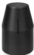
Dimensioni degli Speroni