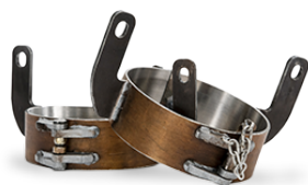
Maneuving Head Dimensions

Disponibile in varie dimensioni per adattarsi ai diversi diametri dei tubi.